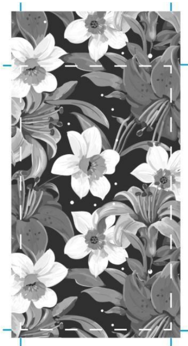
Imagen arte final

El rectángulo en línea blanca discontinua indica el trozo de cortina que veremos cuando la tengamos colgada. El sobrante superior será el enrollado i el inferior el contrapeso.